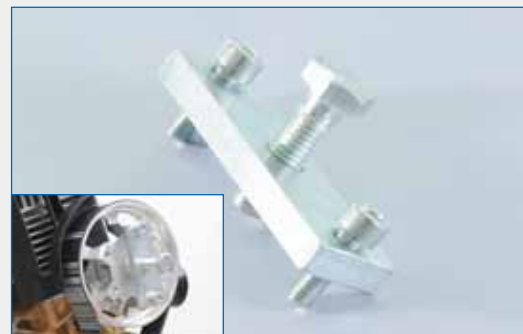
928.695.009 - THOR 190 LIGHT