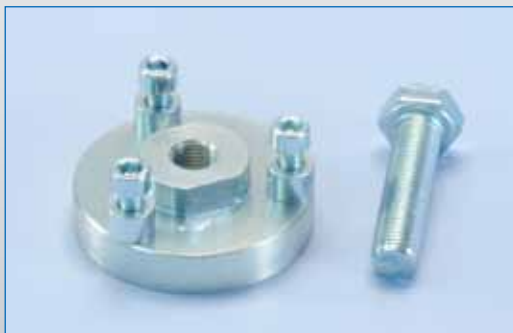
928.695.002 - THOR 100 (fino al motore n. 0675 up to engine n. 0675 - jusqu'au moteur nr. 0675)