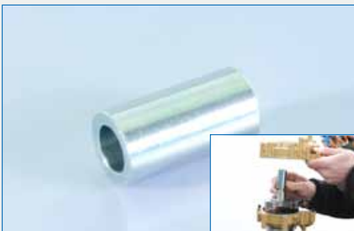
928.695.008 - THOR 190 LIGHT