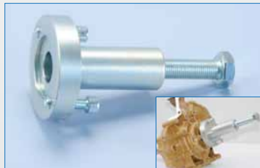
928.695.001 - THOR 100, 130, 190 ELECT. STARTER, 200, 250