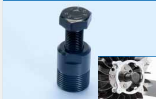
143.695.001 - THOR 100 (dal motore n.0676 - from engine n.0676 du moteur nr.0676) THOR 130, 190 ELECT. STARTER, 200, 250