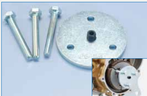
144.695.004 - THOR 100, 130