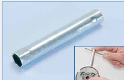
144.695.005 - THOR 100, 130