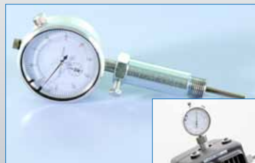
173.0002 - THOR 190 LIGHT (standard and clutched models)