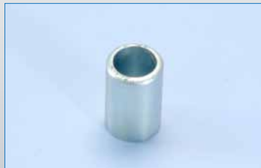
928.695.003 - THOR 100, 130