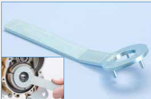
144.695.006 - THOR 100, 130